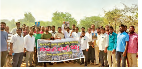
పూడూర్ గ్రామ చెత్త డంపింగ్ యార్డు వద్ద ధర్మా నిర్వహిస్తున్న గ్రామస్థులు

మేడ్చల్, మే 9, ప్రభాతవార్త : మేడ్చల్ సర్పంచిలోని పూడూర్ గ్రామంలో గల చెత్త డంపింగ్ యార్డులో వివిధ ప్రాంతాల నుంచి తీసుకొచ్చి వేస్తున్న చెత్తను నిలిపి వేయాలని డిమాండ్ చేస్తూ ఆ గ్రామ నాయకులు, ప్రజలు వాచానాలు అడ్డుకుని ధర్మా నిర్వహించారు. ఈ సందర్భంగా పలువురు నాయకులు మాట్లాడుతూ పూడూర్ గ్రామం గ్రామ పంచాయతీ ఉన్న సమయంలో చెత్తను వేయడానికి గాను గతంలో ఒక