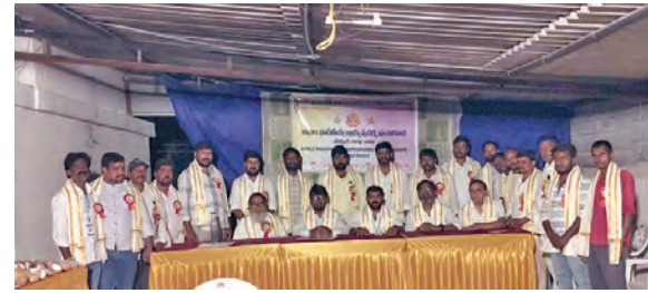
పాస్పాల్ జరిగిన ఎబిఎఫ్ సభలో మేడ్చల్ జిల్లా నూతన కమిటీ అధ్యక్షులు వారి వారసులు.