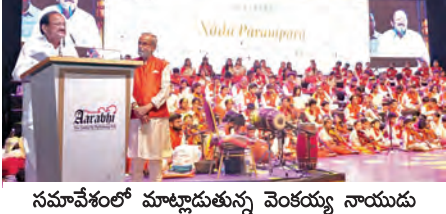
సమావేశంలో మాట్లాడుతున్న వెంకయ్య నాయుడు